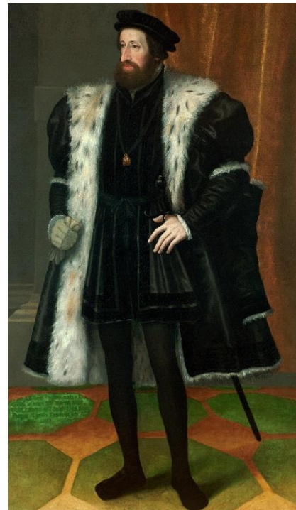
Porträt von Hans Bocksberger