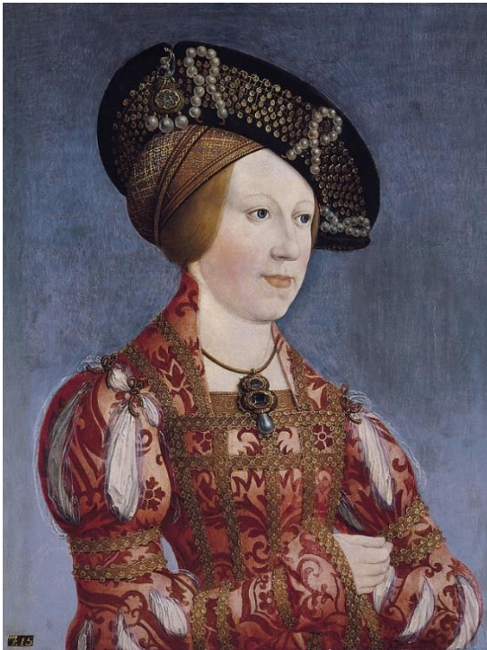
Porträtgemälde von Hans Maler zu Schwaz

Historie: Die Buchstaben A und F stehen für Anna Jagiello , Prinzessin von Böhmen und Ungarn (* 1503 in Buda, + 1547 in Prag) und ihrem Gemahl Erzherzog Ferdinand I. Habsburg (* 1503 bei Madrid, + 1564 in Wien; 1558 bis 1564 Kaiser des Heiligen Römischen Reiches).