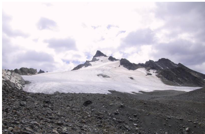
Dreiländerspitze mit Vermuntgletscher